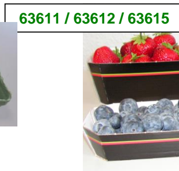
63611 / 63612 / 63615